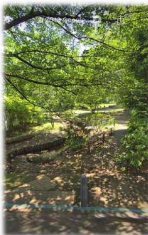
新川丸池公園徒歩3分