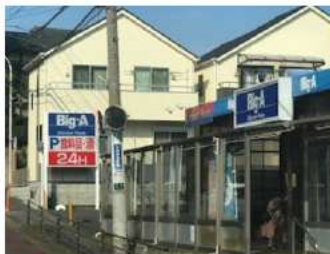
スーパーBig・A前の路地入り、2つ目右折、坂上がる