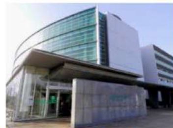
杏林大学医学部付属病院徒歩8分

入居のご相談は..... (株)ナーシングコンシェル ☎080-4123-1939 24時間週7日連絡可