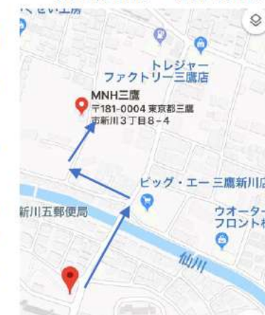
新川団地中央バス亭徒歩5分

限られた予算でその方らしい「自由と安心」 の生活をご家族の替わりになり、医療や介護 チームと連携し、専門のソーシャルワーカー & nコンシェルが付き添います。