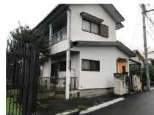
古民家リノベーション