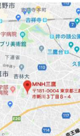
仙川駅北口よりバス7分